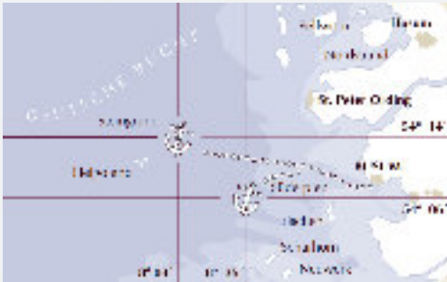
Büsum und Helgoland