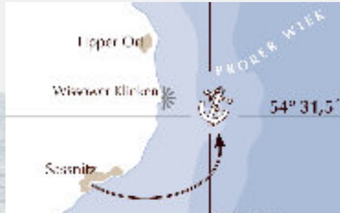
Sassnitz auf Rügen