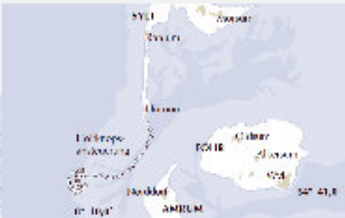
Sylt, Amrum und Föhr